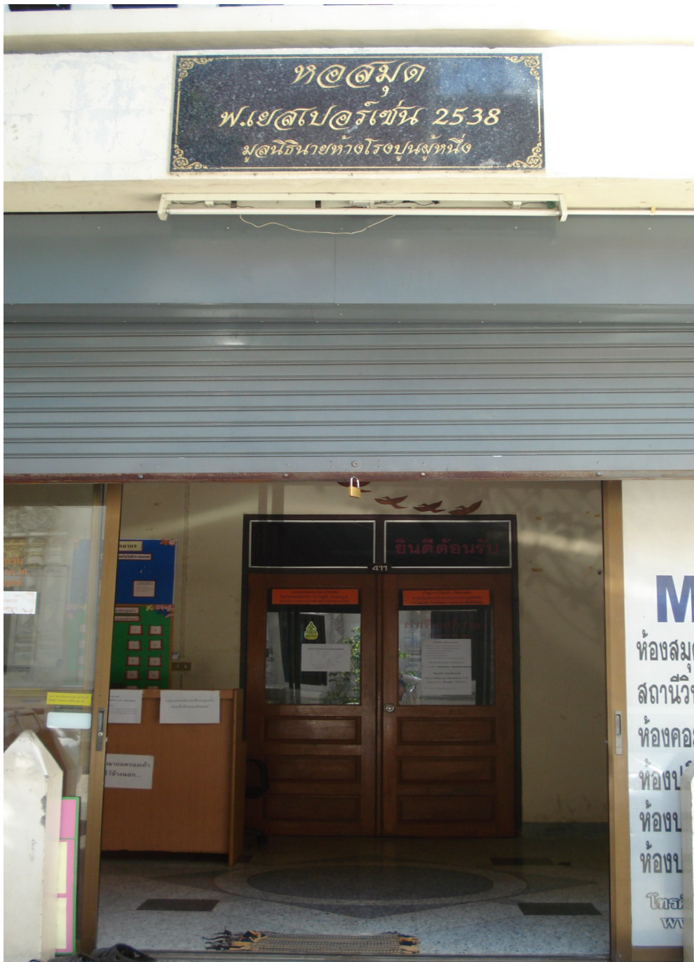
พระพุทธรูปนารายณ์ ดำริให้ก่อสร้างห้องสมุดให้ มหาวิทยาลัยมหามกุฏราชวิทยาลัย วิทยาเขตล้านนา